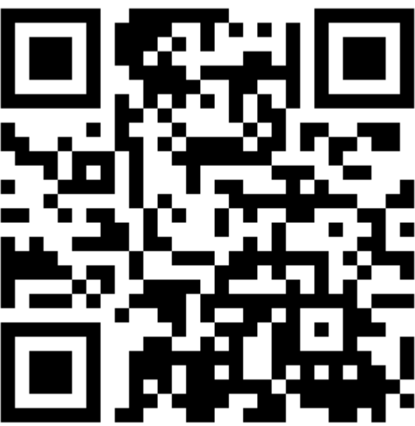
Figura 3. QR activo para participar en la encuesta