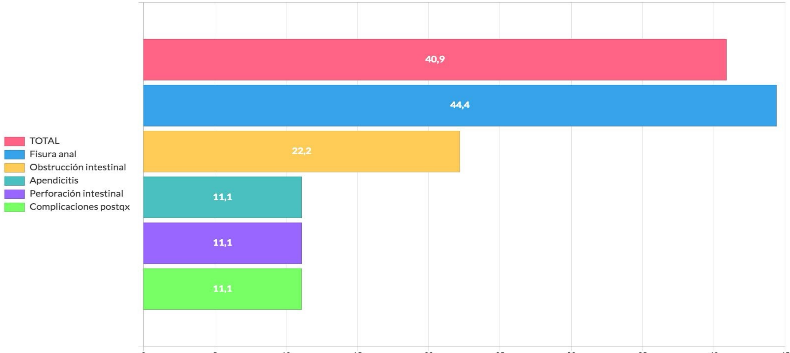
Gráfica 3. Cirugía general urgente (%)

Conclusiones: Una alta tasa de pacientes con enfermedades reumáticas inflamatorias ingresan en el hospital con necesidad de recibir un procedimiento quirúrgico bien programado o urgente. La cirugía urgente más frecuente es la asociada a fracturas. La cirugía programada se distribuye por igual en procedimientos digestivos y traumatológicos.